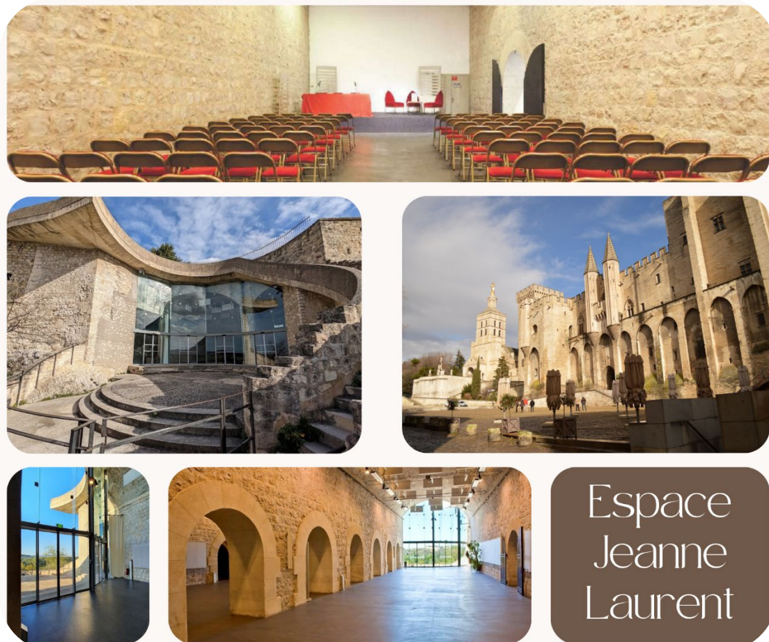
Espace Jeanne LAURENT - Montée Jean XXII, 84 000 – AVIGNON

Les 19 et 20 novembre 2026 , le service départemental d'incendie et de secours de Vaucluse aura l'honneur d'accueillir à Avignon, les 15 èmes Rencontres Juridiques des services d'incendie et de secours (SIS). Elles se dérouleront à l' Espace Jeanne Laurent , situé à deux pas du Palais des Papes, au cœur du Jardin des Doms, qui offre une vue panoramique sur le Pont d'Avignon, Villeneuve-lez-Avignon et le Mont Ventoux.